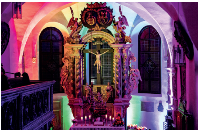
Die St. Georgs-Kirche im bunten Licht - Nacht der Kirchen 2019

seit März letzten Jahres steht Manches in unserem Leben auf dem Kopf. Wir danken herzlich dafür, dass viele Gemeindeglieder mit ihrem Kirchgeld das Leben der Gemeinde weiterhin unterstützt haben. Es kamen 10.175,- Euro an Kirchgeld zusammen, das für das Gemeindehaus bestimmt war. In diesem Jahr nehmen wir unsere Kirche in den Blick.